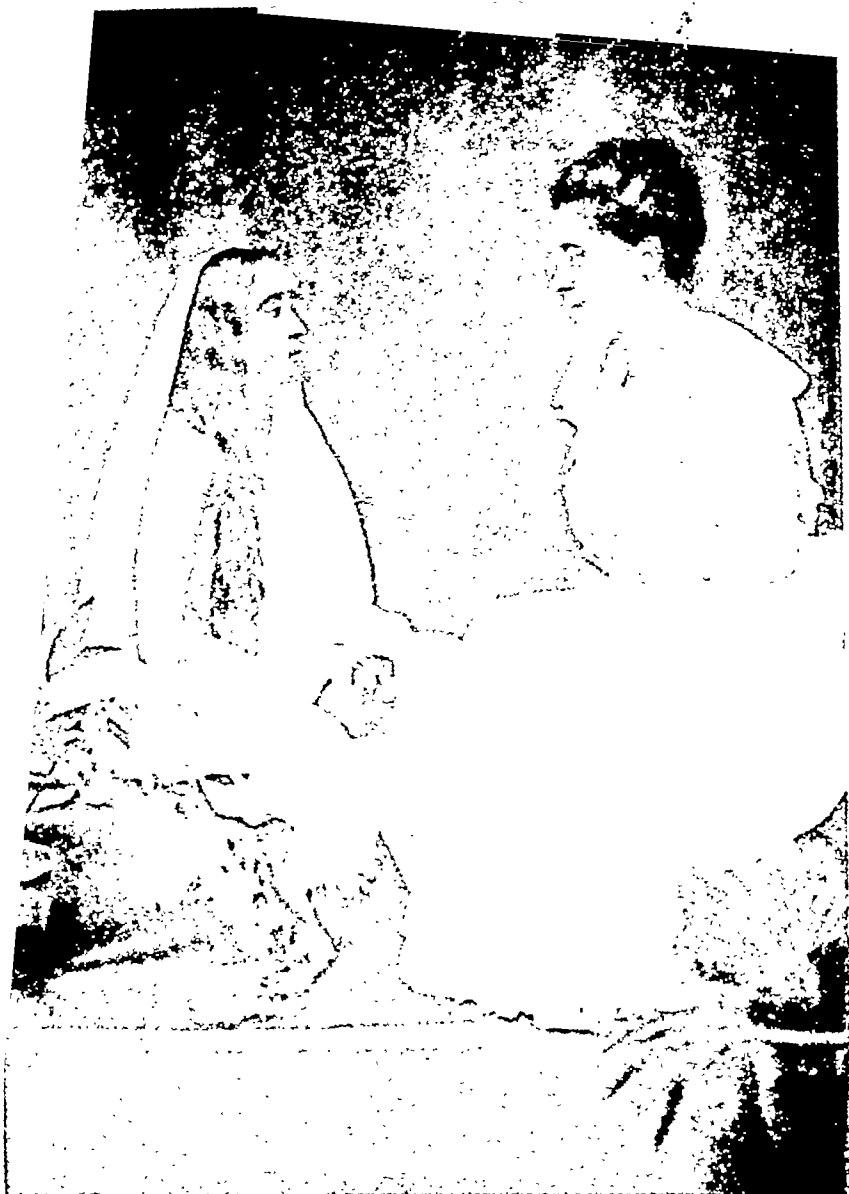
माँ और निवेदिना